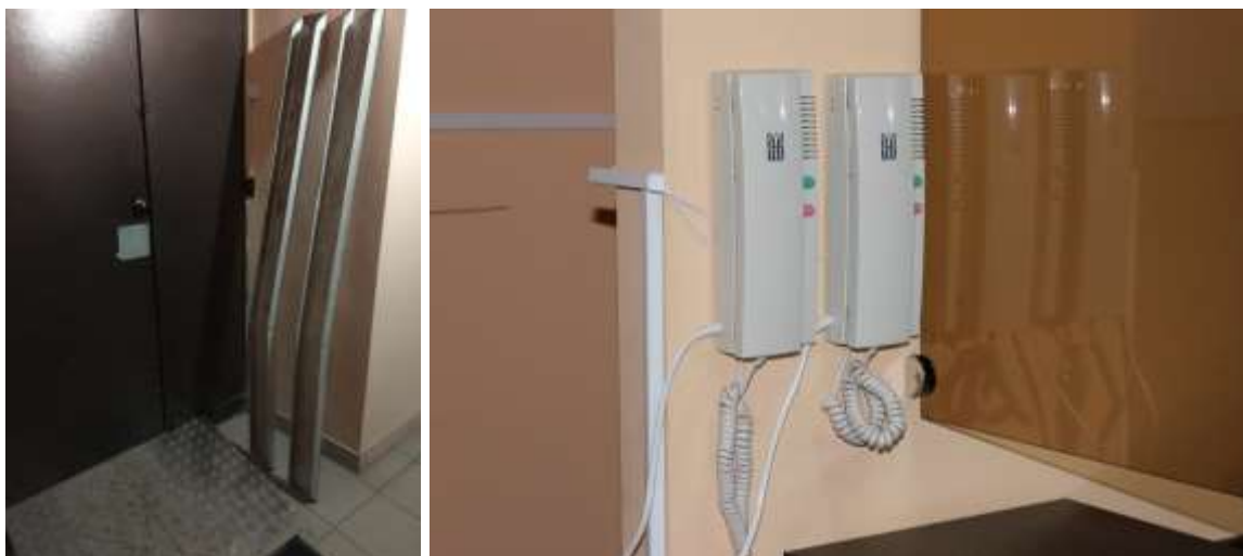
Доступ в здание с улицы обеспечен устройством пандусов