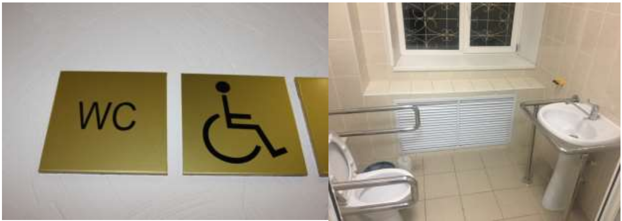
В учебных корпусах оборудованы санитарно-гигиенические помещения (санузлы), адаптированные для людей ограниченными возможностями