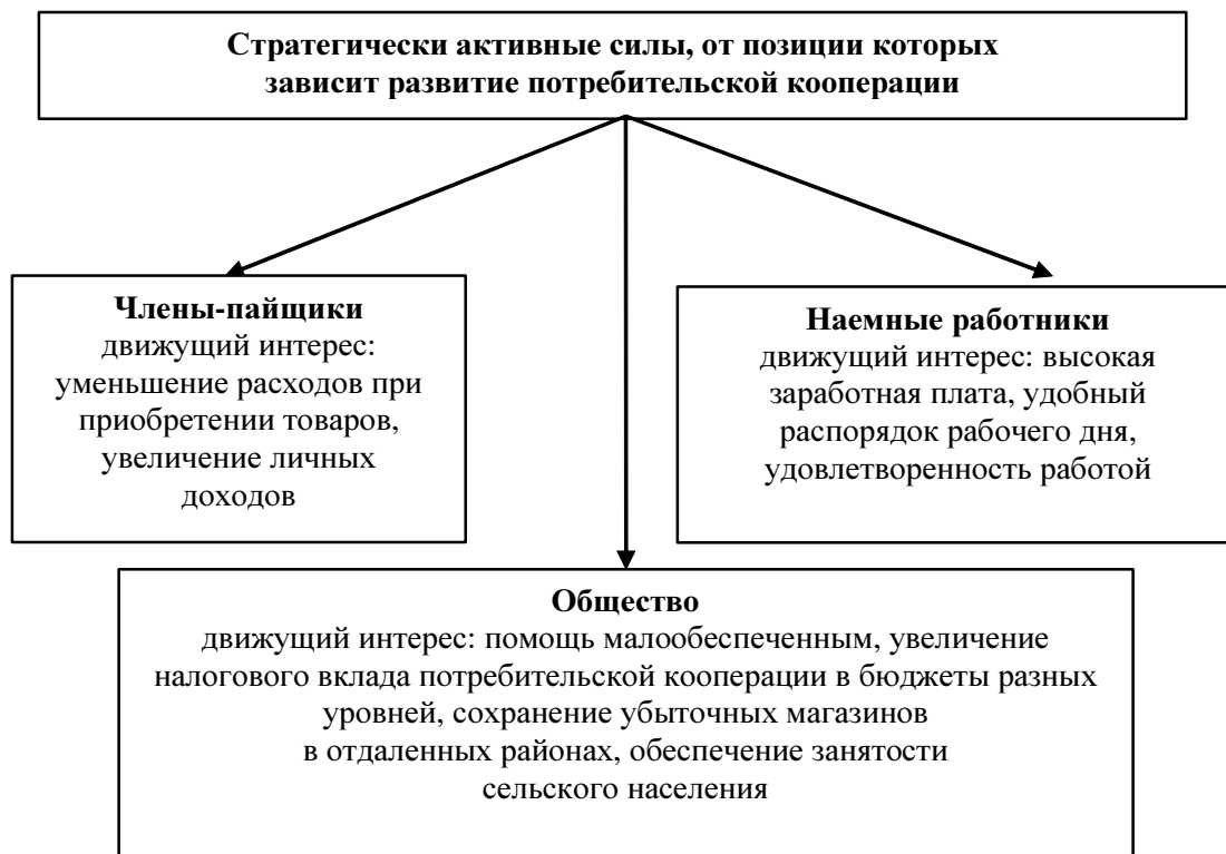
Рис.1. Сфера интересов членов-пайщиков, общества и наемных работников

Экономическими мотивациями участия пайщиков в деятельности потребительской